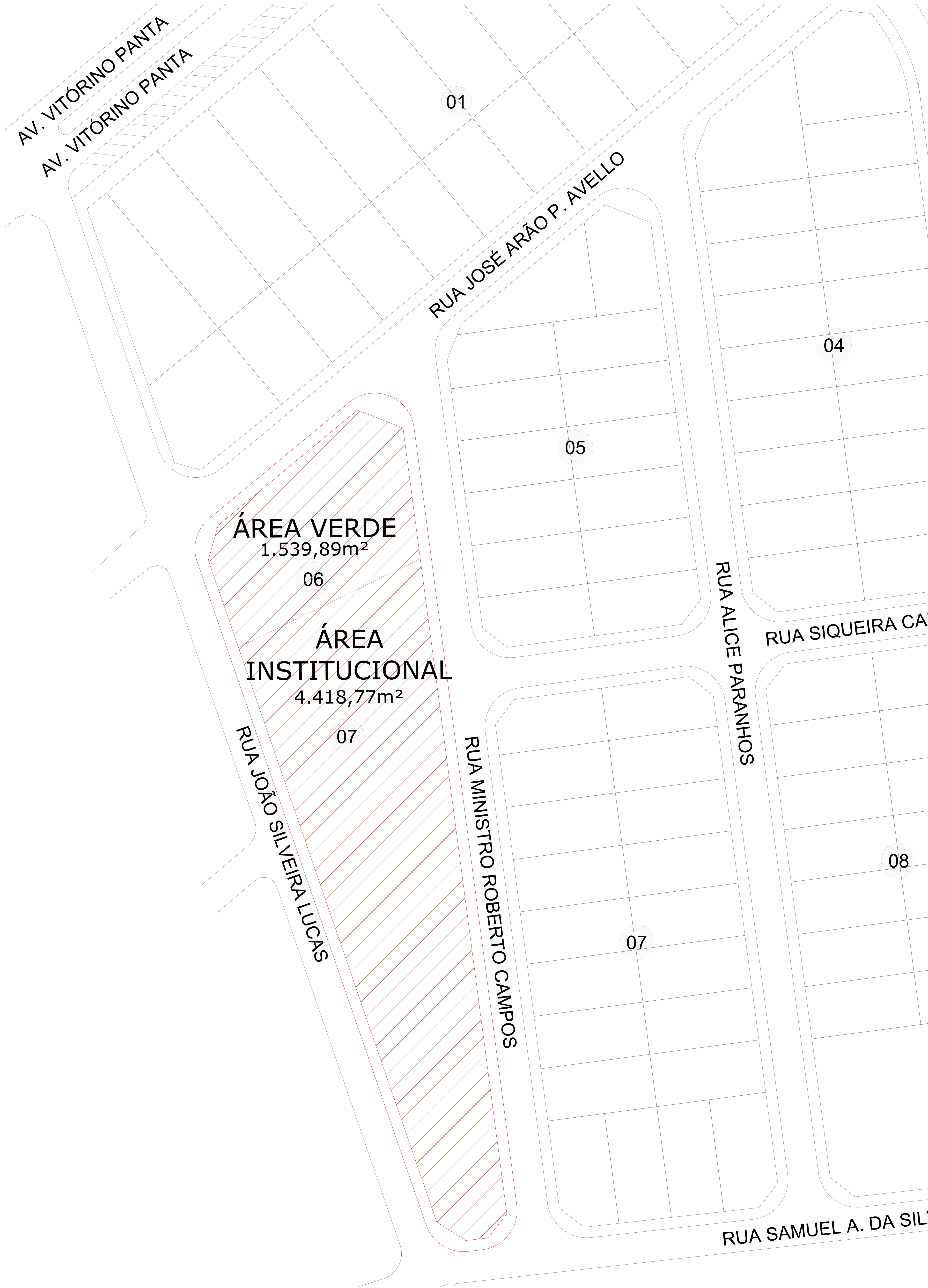
PLANTA DE SITUAÇÃO DO TERRENO Escala: 1:500